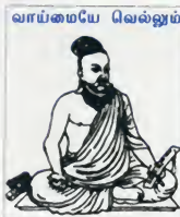
புல்லறிவாண்மை (சிறற்றினர் தம்மைப் பேரிதா மதிக்கல்)